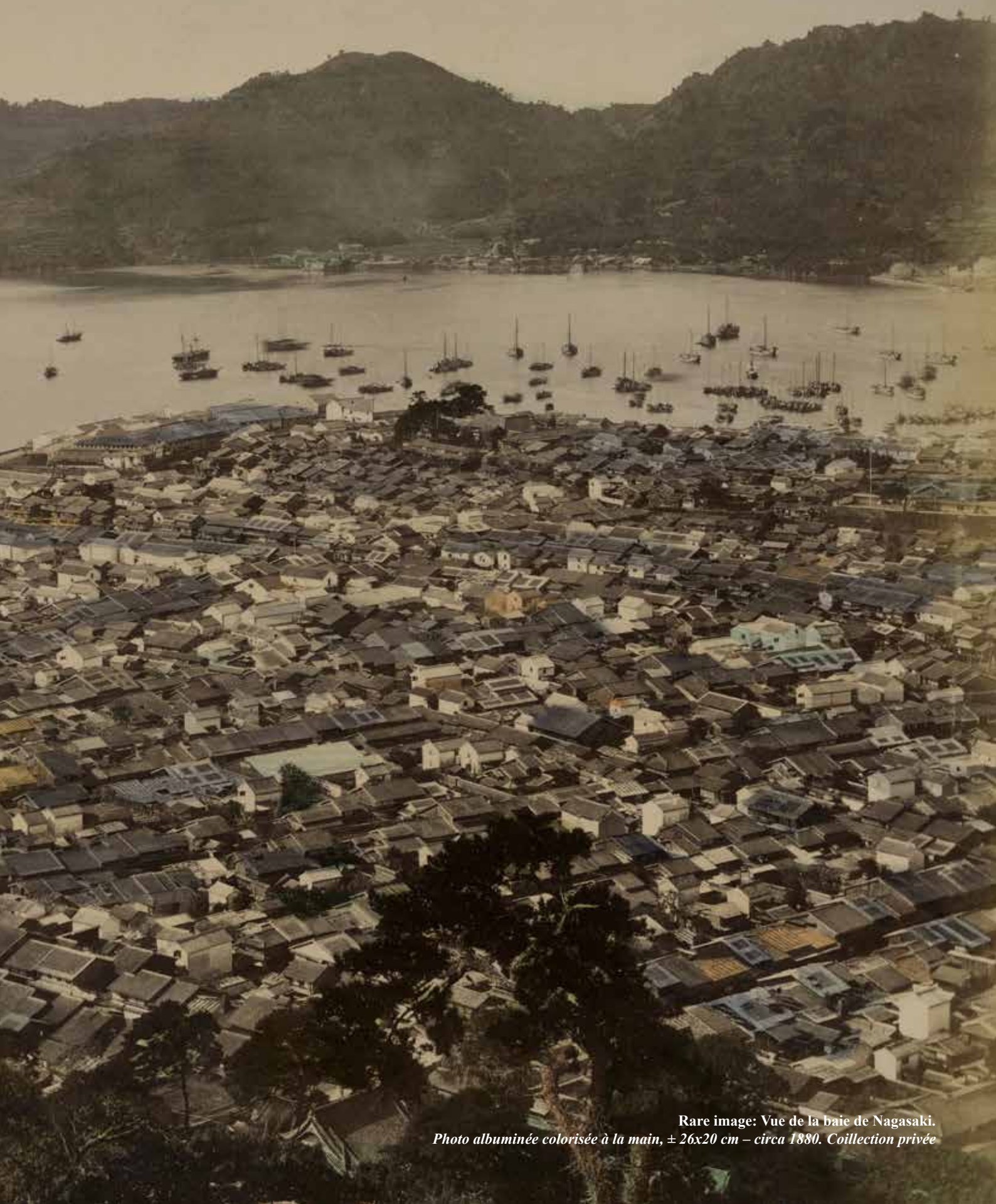
Rare image: Vue de la baie de Nagasaki. Photo albuminée colorisée à la main, ± 26x20 cm – circa 1880.