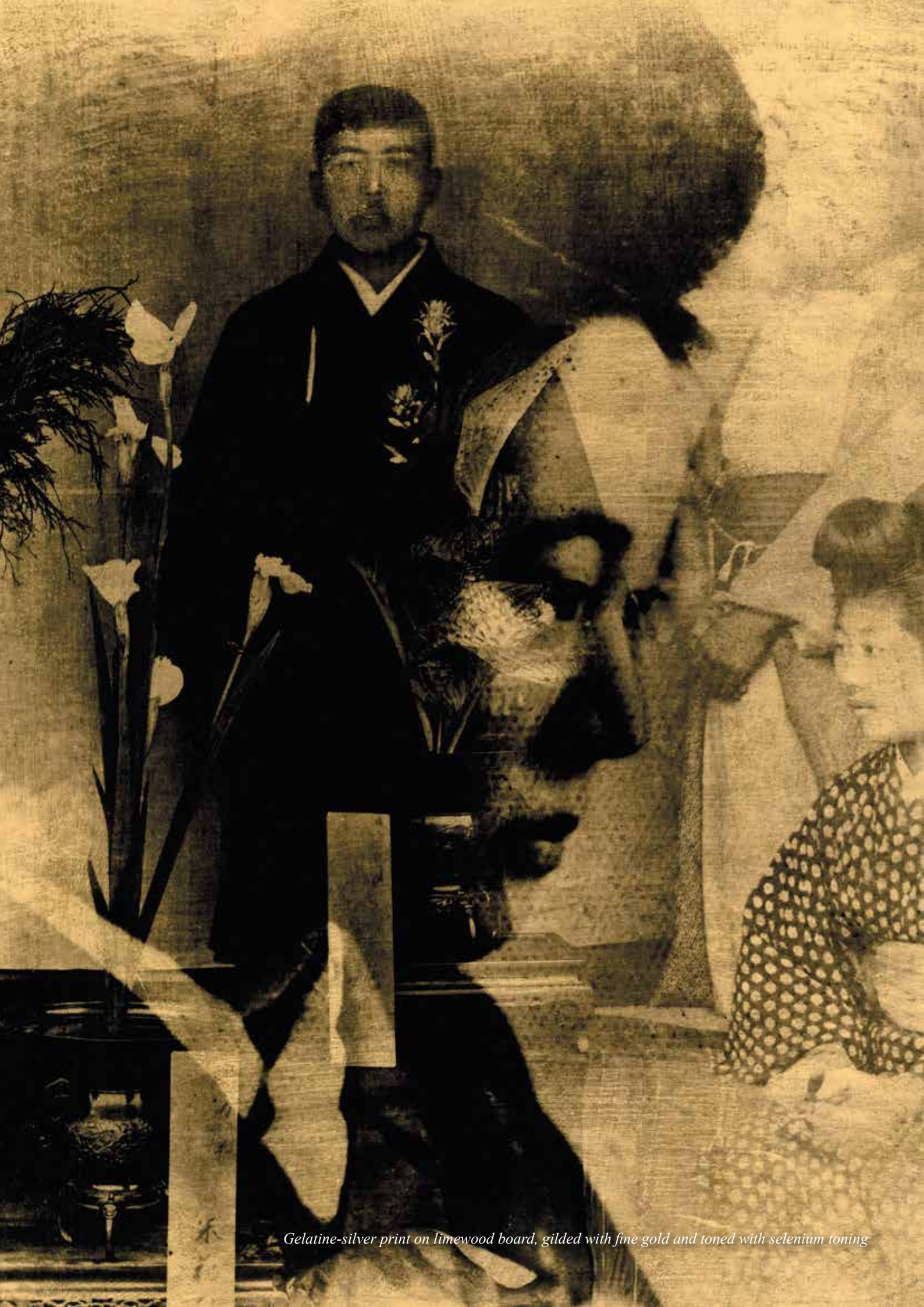
Gelatine-silver print on limewood board, gilded with fine gold and toned with selenium toning