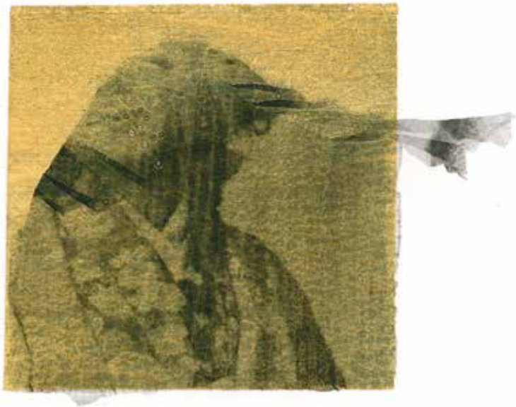
Tirage gélatino argentique sur feuille d'or marouflée sur papier COT 320, virage au selenium