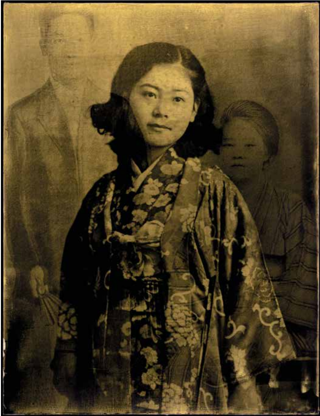
tirage gélatino-argentiques sur tableau de bois de tilleul massif de 27x35 cm doré à l'or fin 22 kt