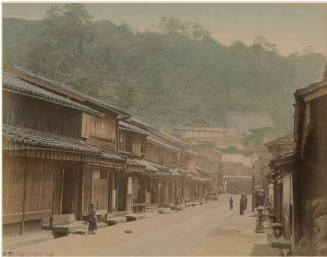
A street of Nagasaki

Au cours de mes recherches sur des documents historiques et des photographies d'Hiroshima et de Nagasaki, j'ai acquis dix-huit tirages à l'albumine coloriés à la main, représentant pour la plupart Nagasaki et ses environs. Cette petite collection privée comprend également trois portraits de femmes et deux paysages de la préfecture de Banshū. La présentation de ces photographies antérieures à l'apocalypse aux côtés des œuvres contemporaines offrirait un contraste visuel saisissant entre deux époques et deux atmosphères radicalement différentes -