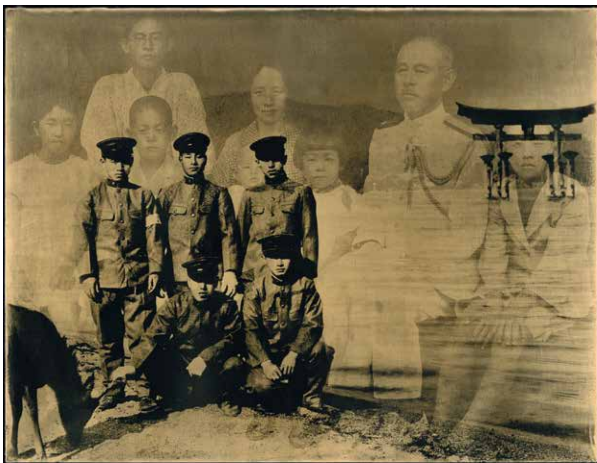
tirage gélatino-argentiques sur tableau de bois de tilleul massif de 27x35 cm doré à l'or fin 22 kt