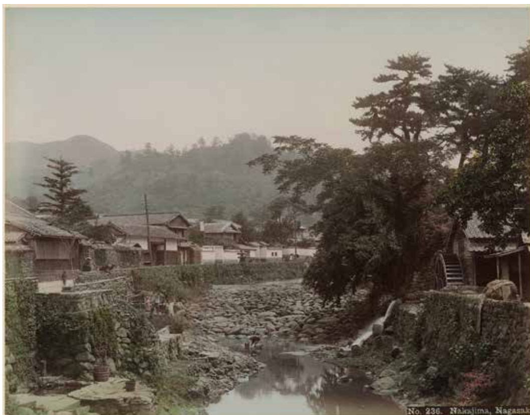
Nakajima, Nagasaki Tirage albuminé colorisé à la main ± 26x20 cm – circa 1880