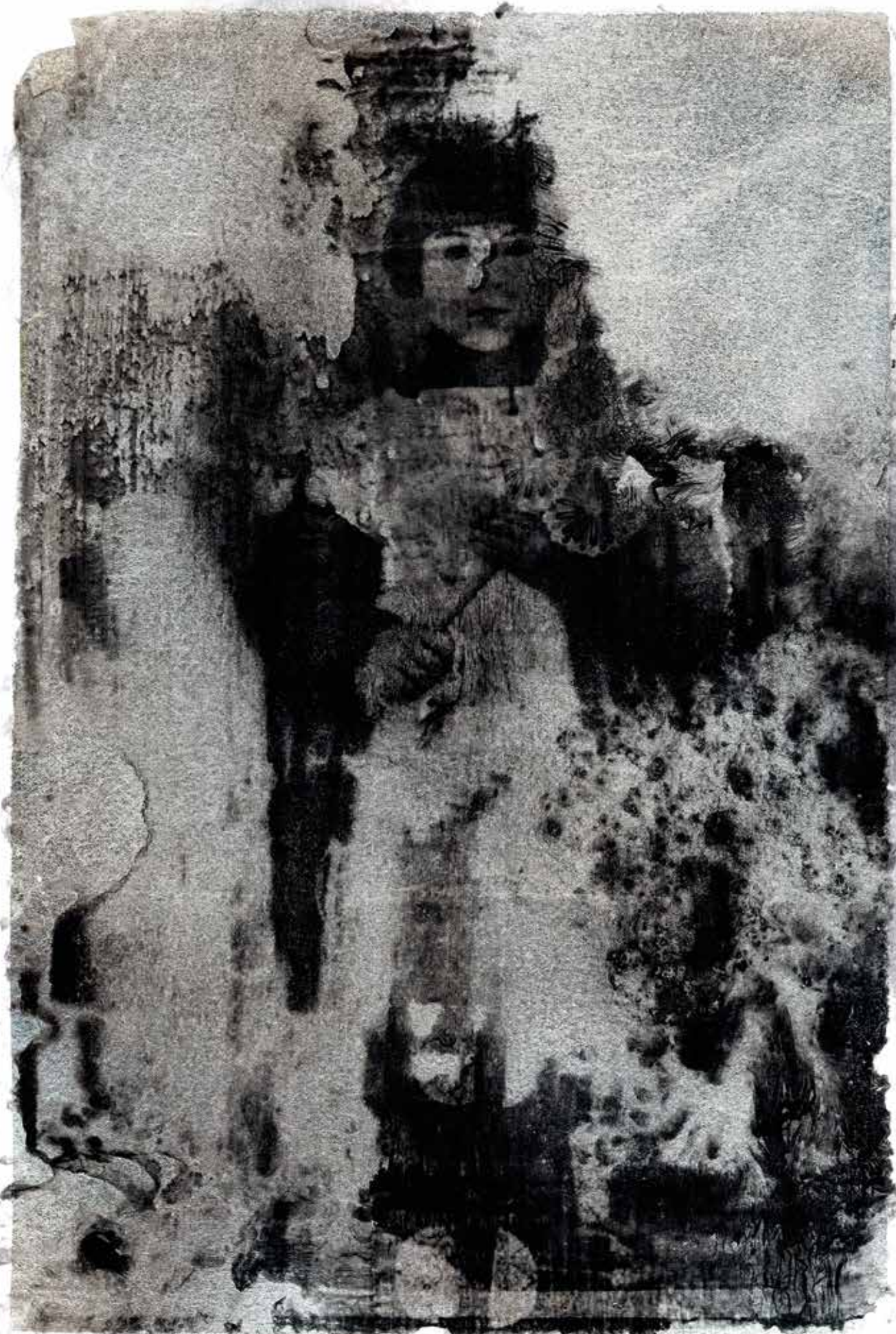
Tirage gélatino-argentique sur feuille d'or blanc marouflé sur papier COT 320, virage au selenium