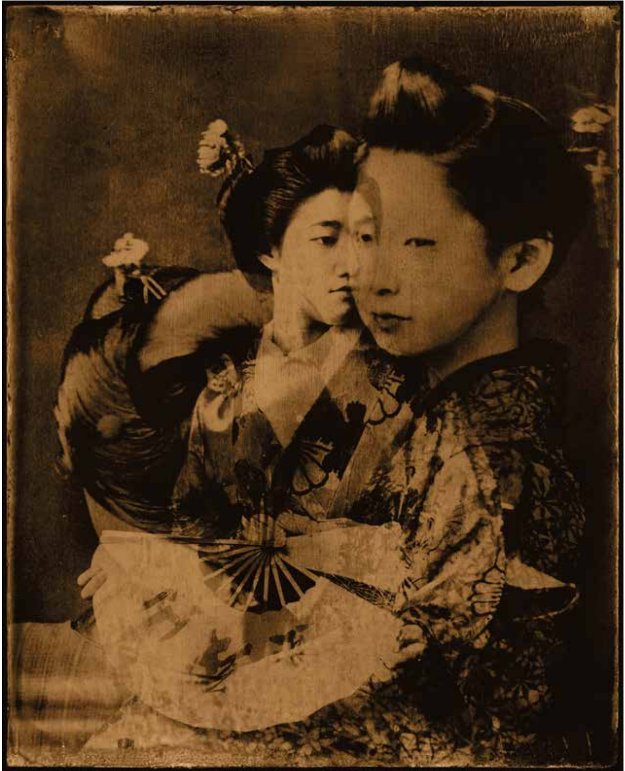
tirage gélatino-argentiques sur tableau de bois de tilleul massif de 27x35 cm doré à l'or fin 22 kt