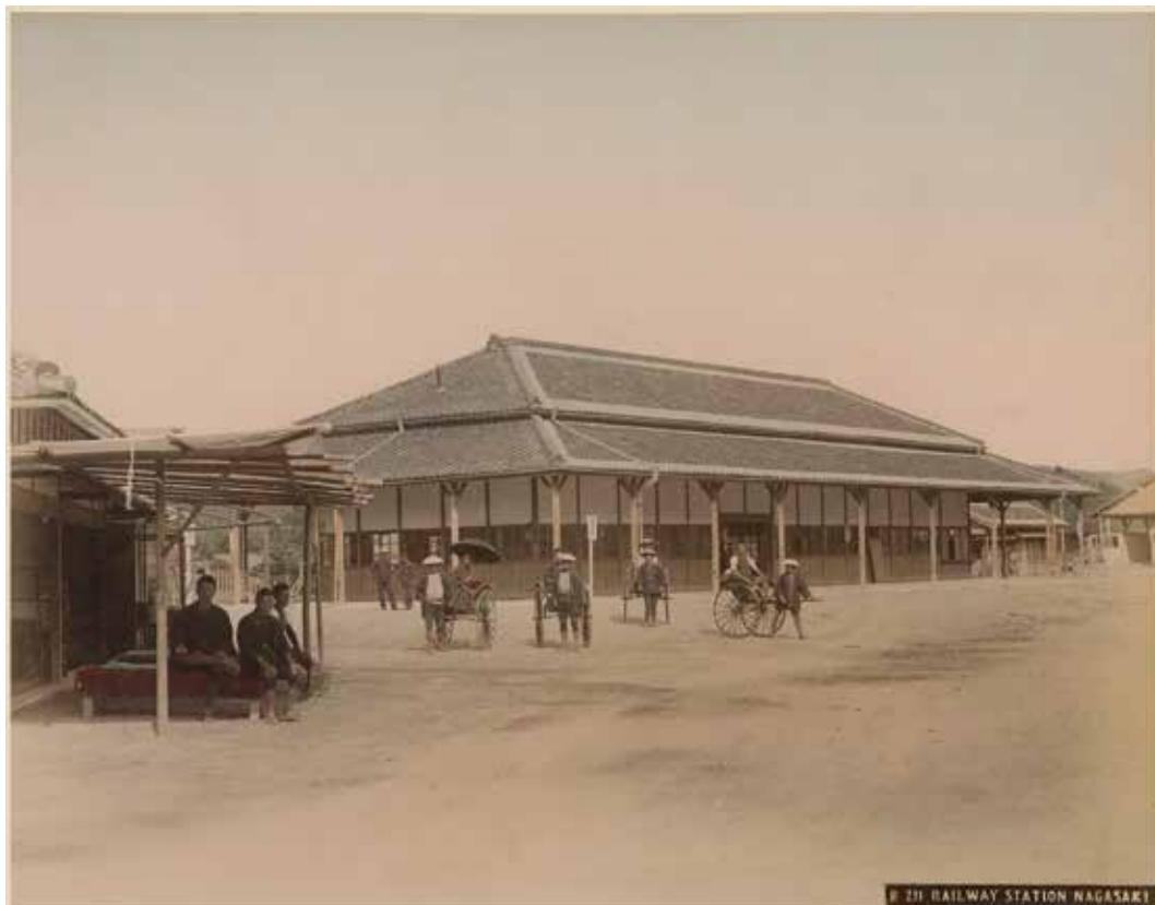
Nagasaki railway station Tirage albuminé colorisé à la main , ± 26x20 cm – circa 1890