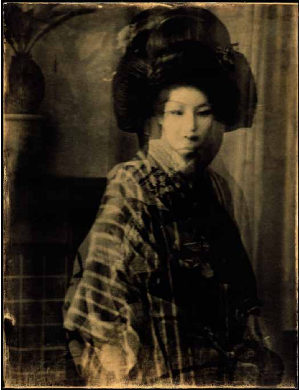
tirage gélatino-argentiques sur tableau de bois de tilleul massif de 27x35 cm doré à l'or fin 22 kt